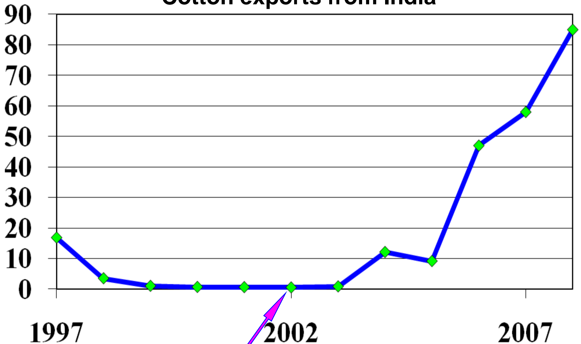
Cotton exports from India