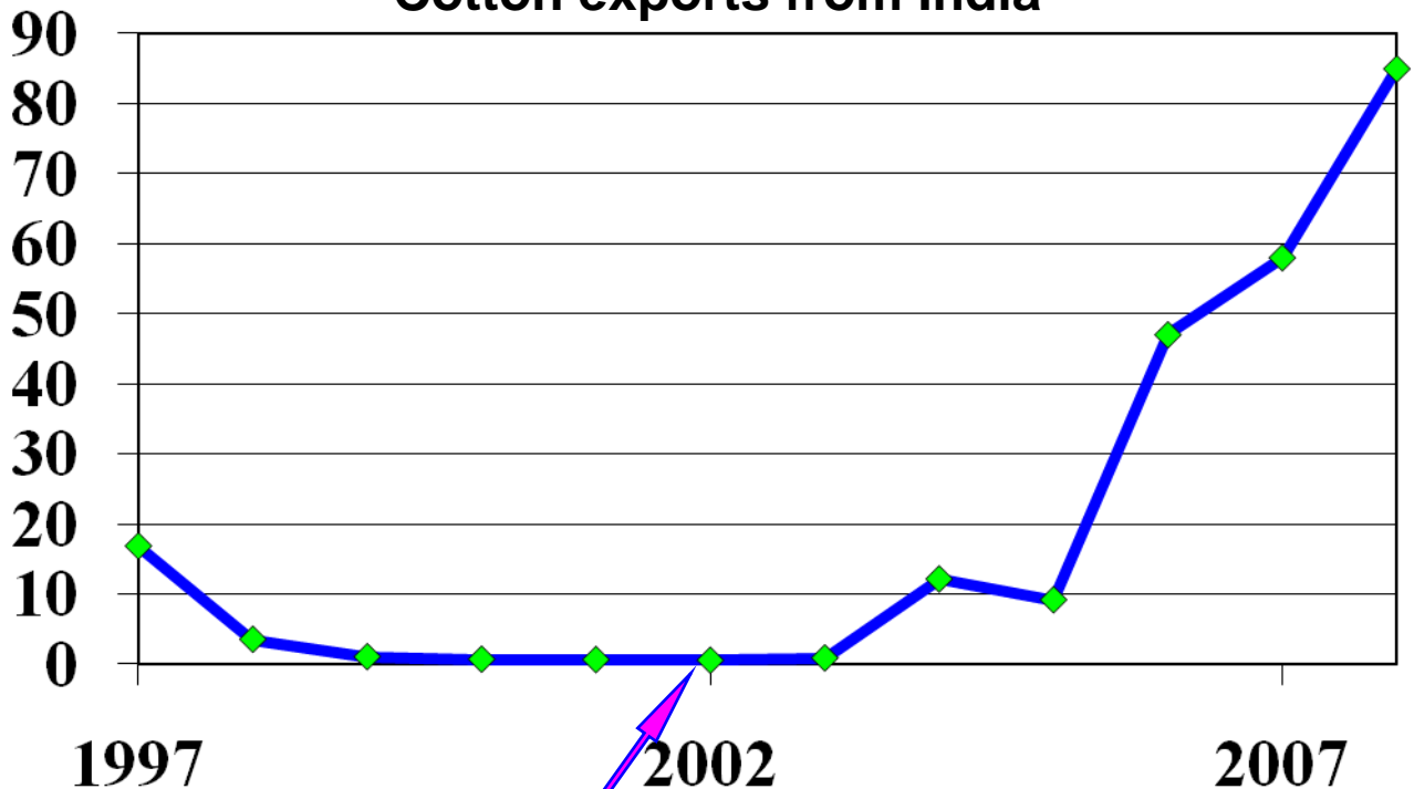
Cotton exports from India