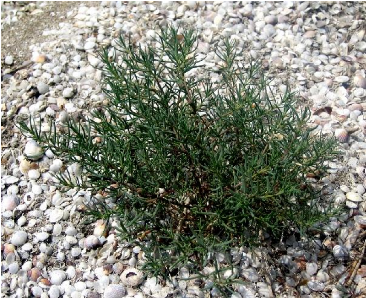
Kuva 2. Merikilokki kasvaa suolaisilla merenrannoilla ja selviää jopa suolankeuruultaiden pohjalla. Kultahietikko, Bulgaria.

Neljäsosa maapallon maa-alasta on suolapitoista, mutta nykyiset viljelykasvit eivät suolaa kestä. Merikilokki ( Suaeda salsa ) sitä vastoin menestyy suolaisilla merenrannoilla (kuva 2). Kiinassa Shandongin yliopiston tutkijat eristivät siitä suolankestävyyden geenin ja jalostivat sen avulla suolankestäviä riisi-, tomaatti- ja soijalajikkeita ( Li ym. 2007 , Zhao & Zhang 2007 ).