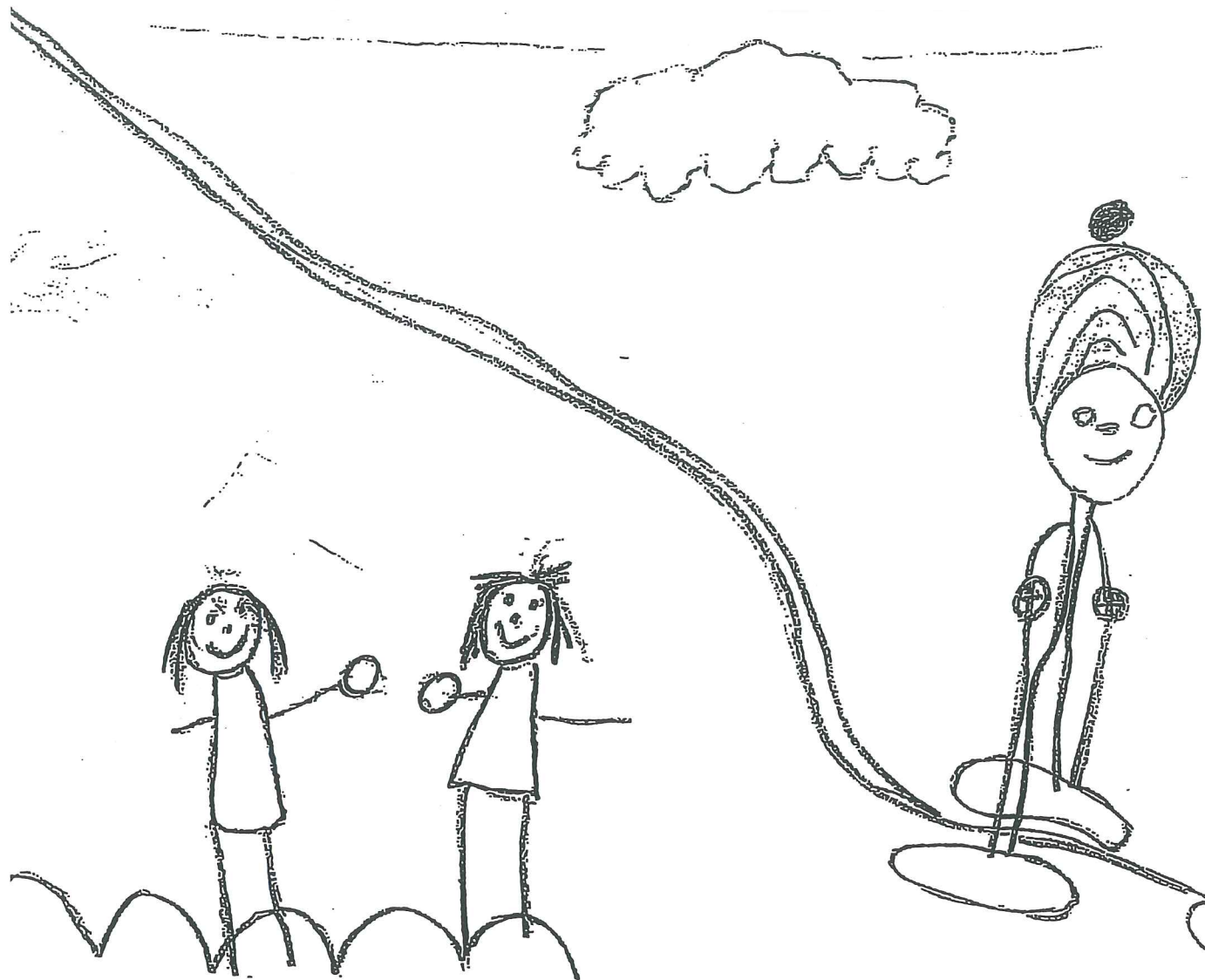
Lumipallon heittäminen on mukavaa.