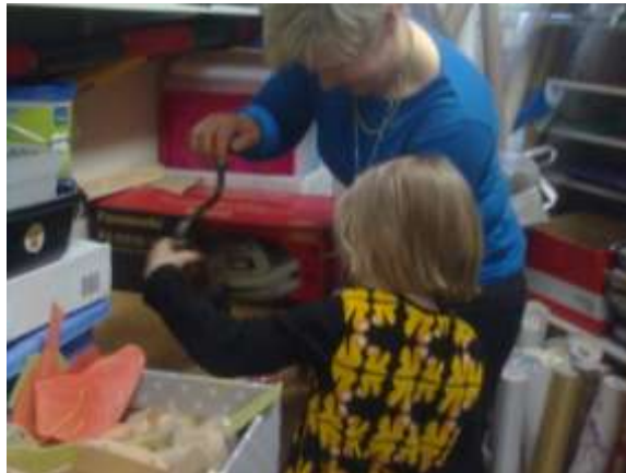
OPPIA IKÄ KAIKKI, KOHTAAMISPAIKKANA PÄIVÄHOIDON ARKI, ERILAISIA OPPIMISYMPÄRISTÖJÄ