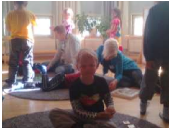
LAPSET JA VANHEMMAT LEIKIN PYÖRTEISSÄ / PELAAMASSA